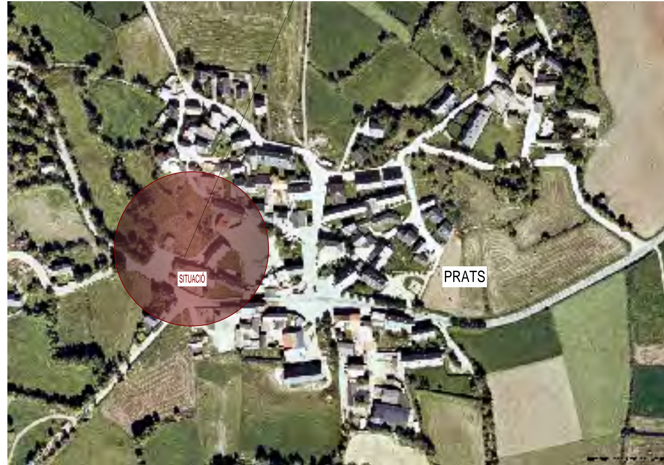
PLÀNOL DE SITUACIÓ. E/ 1:2000

SITUACIÓ CARRER DE LA PLAÇA A LA CARRETERA