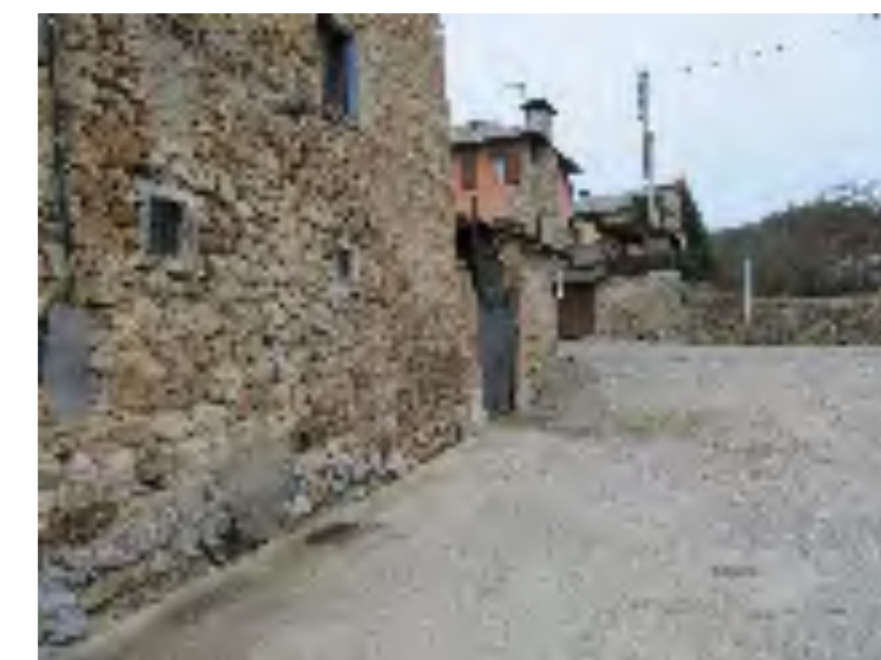
PLÀNOL GENERAL DE PRATS INFORMACIÓ FOTOGRÀFICA